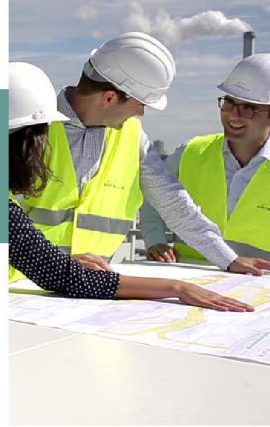
إعادة هيكلة تقاطع كواي دي إيفري سور سين - فرنسا

يجب تسجيل إجراءات الرعاية في حسابات شركة المجموعة المعنية وإبلاغ مسؤولي الأخلاقيات والنزاهة للمجموعة ووحدة الأعمال.