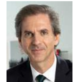
بينوا كلوتشيريت الرئيس التنفيذي

إن التنفيذ الصحيح للإجراءات المنصوص عليها في مدونة قواعد السلوك وبرنامج النزاهة هو أمر يخص كل واحد منا لأنه في الأخلاق قد يؤدي إلى إضعاف السلوك غير اللائق المعزول بل حتى يكتسح الصرح الذي نقوم جميعاً بتشييده أكثر من أي مجال آخر. وعلى الجميع أن يحرصوا على عدم المخاطرة. هيا بنا نكون قوة حسنة ومثالا يحتذى به.